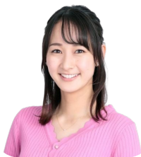
浦口史帆 東海テレビアナウンサー 月曜担当